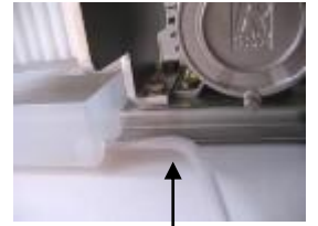
ท่อพลาสติก

- หากเป็นการกรองหลังจากใส่กระดาษกรองใหม่ ให้ใส่ปลายท่อส่งลงในถึงที่1 สักครู่(15-30 วินาที) จากนั้นจึงใส่ปลายท่อส่งลงในถึงเก็บ(ถึงที่ 2) ทั้งนี้เพื่อขจัดกาในของเหลวตอนที่แช่กระดาษกรอง และไฮเซลลูโลสที่อาจหลงเหลืออยู่บนกระดาษกรองใหม่